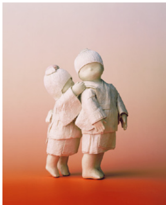
陽香人形「ないしょ話し」20cm (1995)