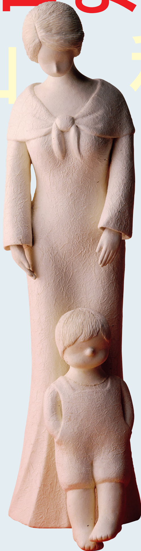
陽香人形「だだっこ」 53 cm 山形県総合美術展入賞 (1993)

白鷹町の伝統文化、県指定無形文化財の 深山和紙によって生み出された芸術 陽香人形の集大成！