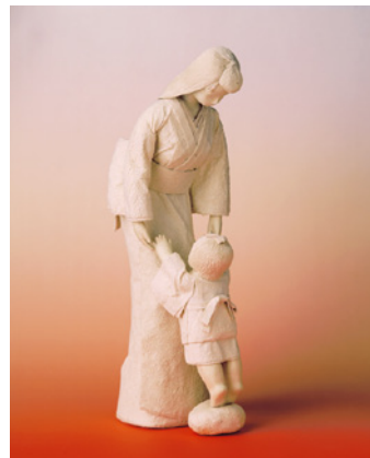
陽香人形「だっこ」36cm 東北現代工芸美術展入選(1984)