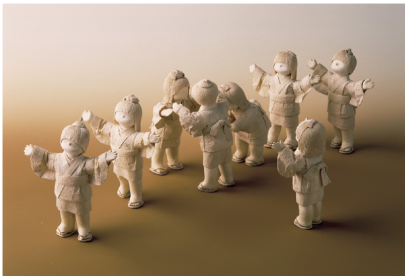
陽香人形「とおりゃんせ」20cm (1996)