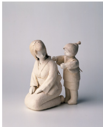
陽香人形「肩たたき」23cm ベルギー国際現代芸術アカデミー参加(1998)